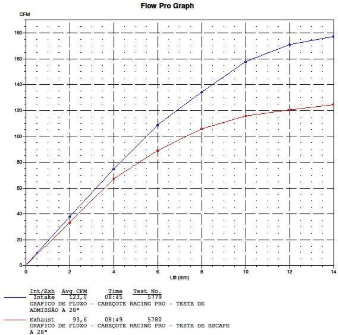
GRAFICO DE FLUXO - CABEÇOTE RACING - TESTE DE ADMISSÃO E ESCAPE A 28"