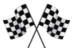
GRAFICO DO COMANDO